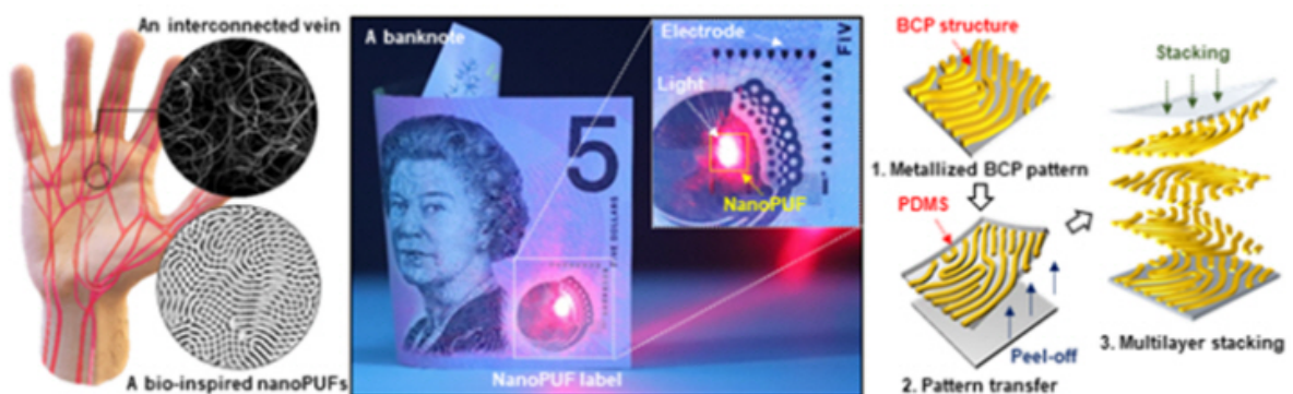
▲ 무작위 형태의 블록공중합체 자기조립 패턴을 적층하여 지문 모양의 나노 패턴의 형성 과정을 보여주는 모식도