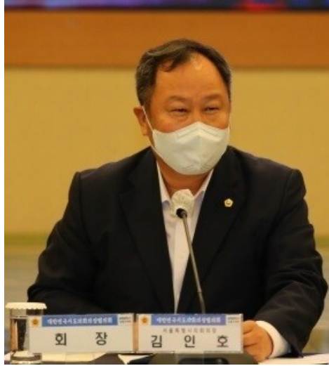
김인호 서울시장.

◇ 대한민국 시·도의회의장협의회는 30일 김인호 서울시장을 제17대 하반기 회장으로 뽑았다. 임기는 내년 6월말까지다.