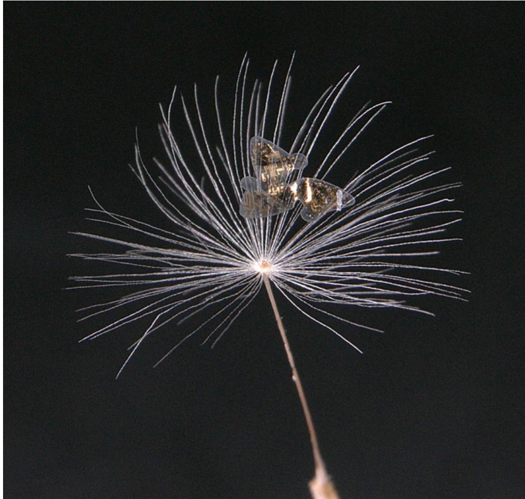
▲ 3차원 전자소자가 민들레 씨앗과 함께 있는 사진 이미지

향후 물에 녹는 재료를 이용해 마이크로플라이어를 만들 계획을 밝힌 김 교수는 "초소형 소자가 공중에서 잘 퍼진다는 것은 회수하기가 어렵다는 뜻이기도 하다. 빗물이나 이슬에 녹는 친환경적인 재료로 만들 것"이라고 설명했다.