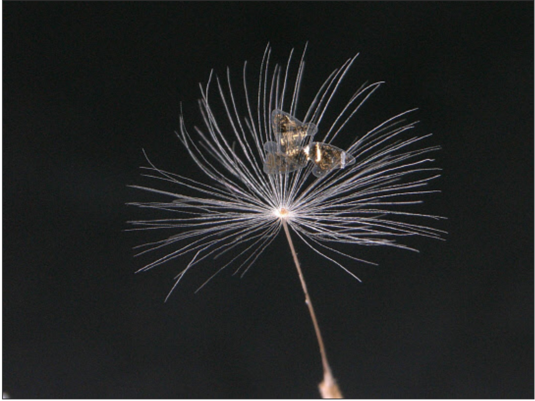
3차원 전자소자가 민들레 씨앗과 함께 있는 사진 이미지.

연구팀은 식물의 씨앗이 바람에 날리는 방식을 낙하산 타입(민들레 씨앗), 헬리콥터 타입(단풍나무 씨앗), 행글라이더 타입(자바오이 씨앗), 스피너 타입(참오동나무 씨앗) 등 네 종류로 나누어 각각 3개씩 총 12가지 디자인을 만들었다.