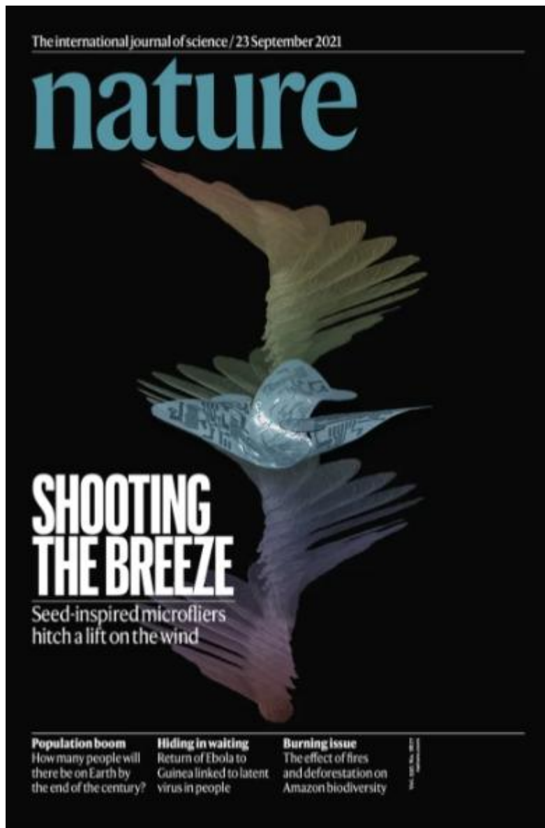
▲ 네이처 표지.

이 중에서 바람을 사용해서 씨앗을 퍼뜨리는 방법은 가장 흔한 전략이나 최대 수십 킬로미터까지 씨앗을 퍼뜨릴 수 있는 강력하고 효율적인 전략이기도 하다.